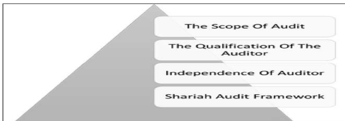
Figure 1. Issues of Shariah Audit