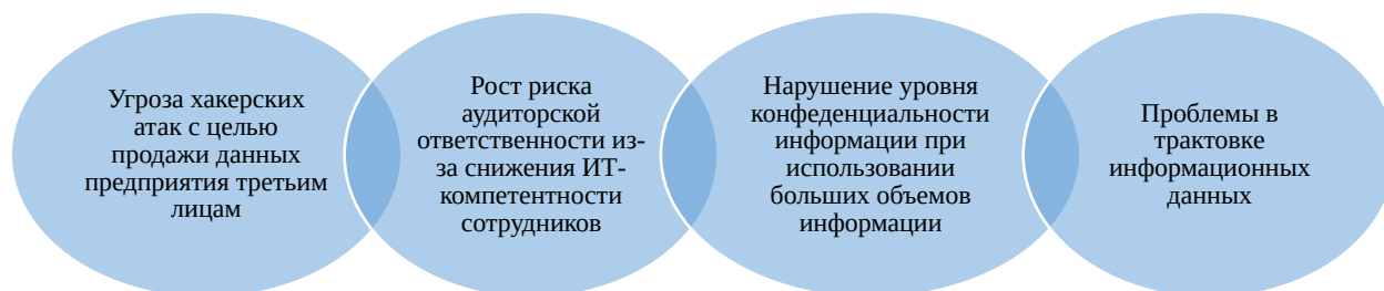
Рисунок 2. Потенциальные проблемы, связанные с цифровой трансформацией аудита [1]

Несмотря на развитие цифрового аудита и его значительные преимущества в проведении финансовых проверок, у цифровизации системы аудита есть и обратная сторона – потенциальные проблемы, связанные с её внедрением.