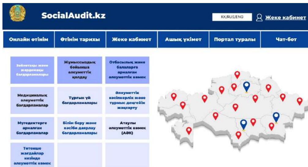
Сурет 3. «SocialAudit.kz» сайты негізгі беті

алуға, екіншіден, статистикалық деректер қорының орталықтанған жүйесі құруға, үшіншіден, аудит нәтижелері туралы аудиторлық қорытындылар мен есептерді алуға мүнкіндік береді. Аудиторлар үшін сайттың келесідей артықшылықтары бар, олар 3-суретте көрсетілгендей аудиторларға арналған әдістемелік ұсыныстар, әлеуметтік бағдарламалардың нақты көрсеткіштері мен статистикалық мәліметтерін қамтитын деректер базасы, аудит жүргізудің қадамдары мен қажетті құжаттар, аудит нәтижелері бойынша автоматты түрде есеп беру жүйесі қарастырылған.