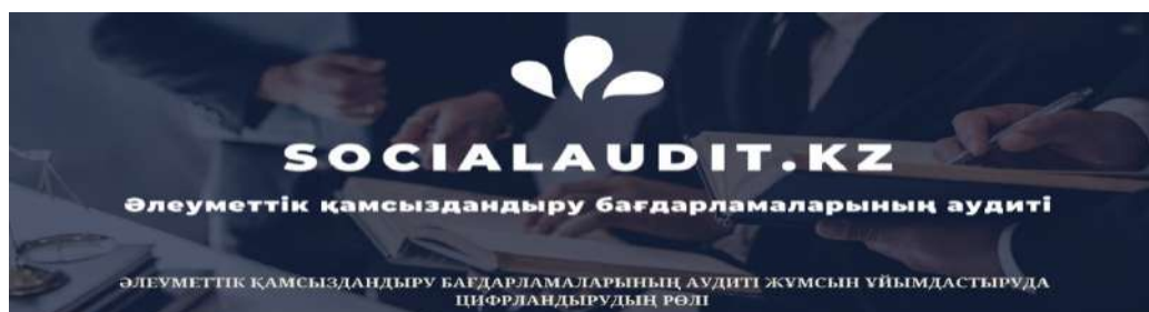
Сурет 2. «SocialAudit.kz» сайты

Нөлдік гипотезаны і орындалмауы бұл әлеуметтік қамсыздандыру бағдарламаларының мақсатының орындалмауын, нәтижелердің тиімсіздігін көрсетеді. Осы саланы зерттей отырып келесідей ұсыным береміз, яғни әлеуметтік аудитке арналған орталықтандырылған «SocialAudit.kz» сайты жасап шығару. «SocialAudit.kz» басты артықшылығы әлеуметтік аудитті енгізілгенде аудиторлардың жұмысын жеңілдетеді.