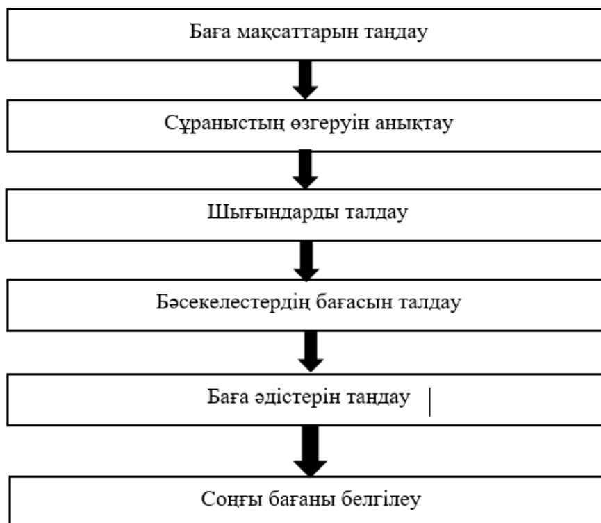
Сурет 1. Баға құрылымы

Баға белгілеу – бұл күрделі, көп сатылы процесс, оны келесі түрде ұсынуға болады: (Сурет 1).