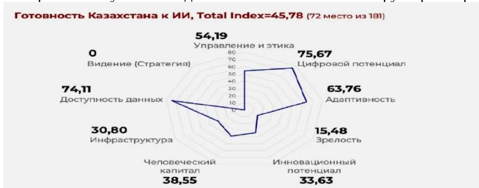
Рисунок 1. Готовность Казахстана к внедрению искусственного интеллекта

Согласно Индексу готовности правительства к искусственному интеллекту 2023 года, Казахстан занимает 72-е место среди 193 стран. К числу конкурентных преимуществ страны относятся высокая доступность данных, значительный цифровой потенциал и гибкость правового регулирования, адаптируемого к цифровым бизнес-моделям. В то же время среди ключевых ограничений выделяются отсутствие стратегического видения, низкая технологическая зрелость, слабо развитая инфраструктура, ограниченный инновационный потенциал и недостаточный уровень человеческого капитала. Дополнительно, анализ отдельных показателей индекса выявляет дефицит крупных частных технологических компаний, недостаточный объем венчурного капитала и низкий уровень финансирования научно-исследовательских и опытно-конструкторских работ [7].