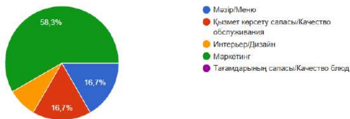
Ескертпе – зерттеу барысында сауалнама нәтижелері бойынша әзірленген Сурет 2 – Мейрамхана қызметін жақсартудың жолдары

Сурет 2 деректеріне сүйенсек, респонденттер ұлттық мейрамханалардың дамуында бірқатар әлсіз тұстарды атап өткен.