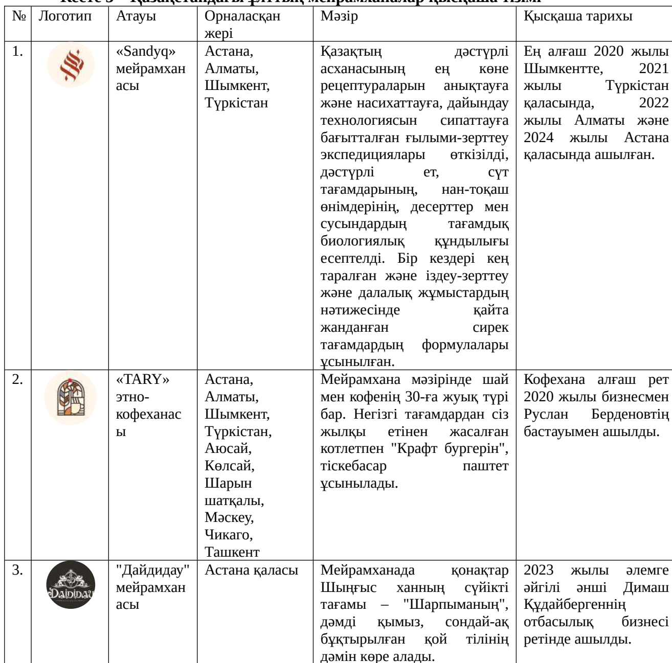
Кесте 3 – Қазақстандағы ұлттық мейрамханалар қысқаша тізімі

Соңғы жылдары осындай дәстүрлі тағамдарды ұсынатын заманауи ұлттық мейрамханалар саны артты (кесте 3). Бұл мекемелер гастрономиялық туризмнің инфрақұрылымын қалыптастырып, елге келуші туристерге жергілікті болмысты сезінуге мүмкіндік береді.