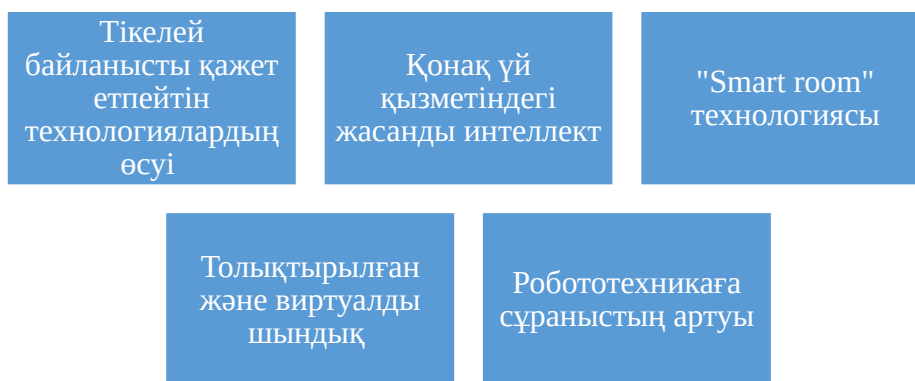
Сурет 2. Қонақ үй бизнесін басқаруда цифрлық трансформацияны қалыптастыратын негізгі тенденциялар

Ескертпе - мәліметтер [1] негізінде автормен құрастырылған