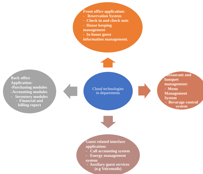
Figure 2. Cloud technologies in departments in the hotel industry [7]

Based on the information from Figure 2, the figure illustrates the integration of cloud technologies in hotel operations, which is demonstrate their practical applications in key areas. Front-office systems facilitate reservations and housekeeping, while back-office solutions improve accounting and inventory management. Restaurant and banquet management utilize cloud tools for menu adjustments and inventory tracking, and guest-related services implement energy management systems and auxiliary features to cater to guest needs. Thus, these examples reflect how cloud technologies support operational improvement and service delivery across the hospitality sector [7].