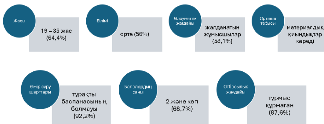
Сурет 1 Баласынан/балаларынан бас тартқан аналардың әлеуметтік портретінің моделі

Бұл портрет баласынан/балаларынан бас тарту туралы шешім қабылдауға ықпал ететін қиын өмірлік жағдайларды, соның ішінде экономикалық тұрақсыздықты, тұрғын-үйдің және әлеуметтік қолдаудың жоқтығын көрсетеді.