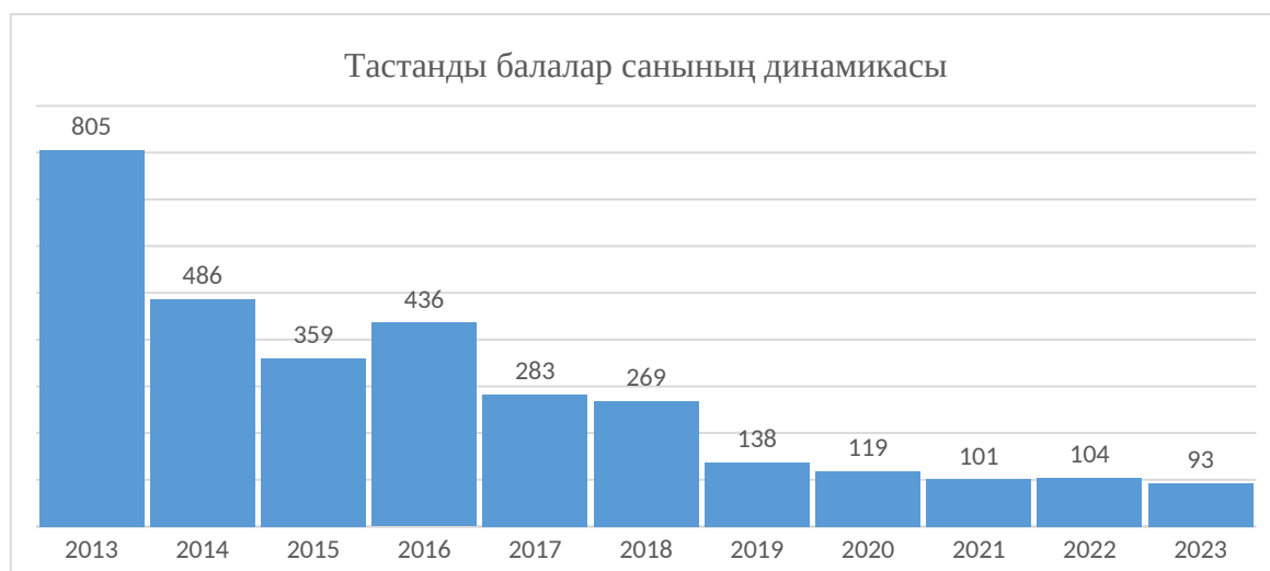
Диаграмма 1 2013-2023 жылдар аралығындағы тастанды балалар санының динамикасы

Ал Қазақстандағы жағдайды талдайтын болсақ, Қазақстан Республикасы Стратегиялық жоспарлау және реформалар агенттігі Ұлттық статистика бюросының деректеріне сүйенсек 2023 жылғы ата-анасының қамқорынсыз қалған балалар мен жетім балалардың жалпы саны 3727 бала, оның ішінде әлеуметтік мәртебесі бойынша тастанды балалардың саны 93 баланы құрайды. 2013-2023 жылдар аралығындағы әлеуметтік мәртебе бойынша тастанды балалар санының динамикасы 1 диаграммада көрсетілген [7].