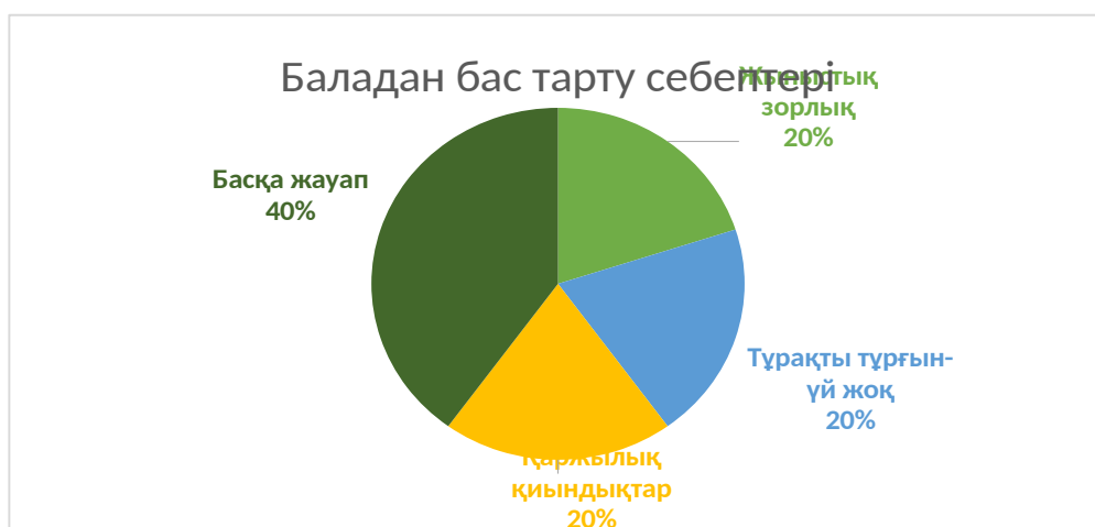
Диagramма 3 Баласынан/балаларынан бас тарту себептері

Баласынан/балаларынан бас тартқан аналардың жас аралығы 13 пен 42 жасты құрайды. Бұл жасөспірімдерді де, ересек әйелдерді де қамтитын өте кең ауқым. Баласынан/балаларынан бас тартқан аналардың типтік жасы 20-30 жас, себебі жасөспірімдік ерте жүктілікпен немесе жыныстық зорлықпен, ал 35 жастан кейінгі жасты саналы, бірақ өмірлік жағдайларға байланысты баладан бас тартуға мәжбүр болу шешімдерімен байланыстыруға болады. Жасөспірімдік жастағылар (13-18 ж.) ана болуға дайын емес, тәжірибенің және қолдаудың жоқтығын да көрсетуі мүмкін. Ал біздегі кейстерде ол 13 жастағы жасөспірімнің баладан бас тартудың себебі жыныстық зорлықпен байланысты.