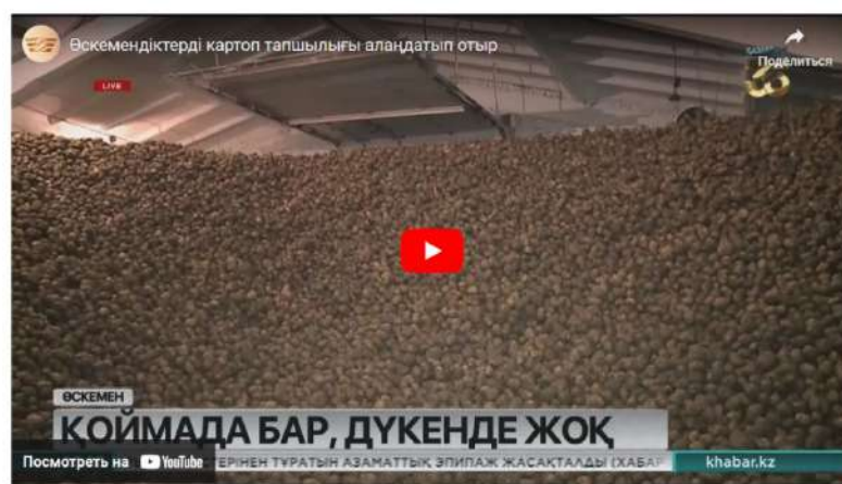
6-сурет. Khabar news телеарнасының ресми сайты

«Құрайды». «Ауыз сумен қамтылған ауылдар үлесі 97 пайызды құрайды». Бүгінде тілшілер де, басқалар да жаппай осылай айтып, жазып жүр. Бұл да орыстың «составляет ... процентов» дегенінен сөзбе-сөз аударып алған. Бұл «бас құрау» (үйлену), «робот құрау» сияқты тіркестер түрінде келсе, айтар мағынасы басқаша. Ал «құрау» сөзі мысалға келтірген сөйлемге келісіп тұрған жоқ. Дұрыс нұсқасы – «Ауыз сумен қамтылған ауылдар үлесі – 97 пайыз». Qazaqstan телеарнасының 2023 жылы Қарағанды облысындағы ауыз сумен қамтамасыз ету жайлы ақпараты бойынша да бұл қателікке де әлі жол беріледі.