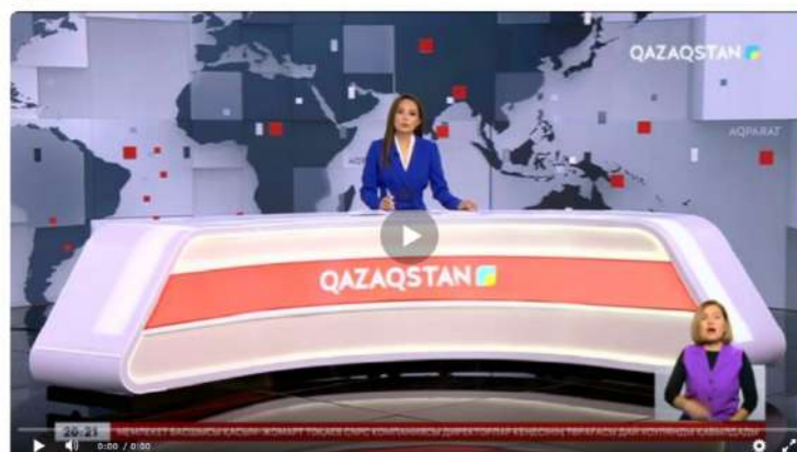
7-сурет. Qazaqstan телеарнасының жаңалықтар легі

Қорытынды. Ғылыми мақаланы зерттеу барысында қазақ тіліндегі жаңалықтардың ақпарат берудегі тіл мәселелері, әсіресе орыс тілінен калькаланған аудармалар мен қателіктер талқыланды. Бұл мәселенің түпкі себебі – екі тілдің синтаксистік құрылымдарының айырмашылығы, сондай-ақ қазақ тілінің кейбір терминдер мен тіркестер үшін әлі де толыққанды баламаларының болмауы. Телехабарлар мен БАҚ-тардағы тілдік қателіктер, атап айтқанда, калькалардың кең таралуы, қазақ тілінің табиғатына сай келмейтін сөздер мен тіркестердің қолданысы қазақ тілінің сапасына теріс әсер етуде.