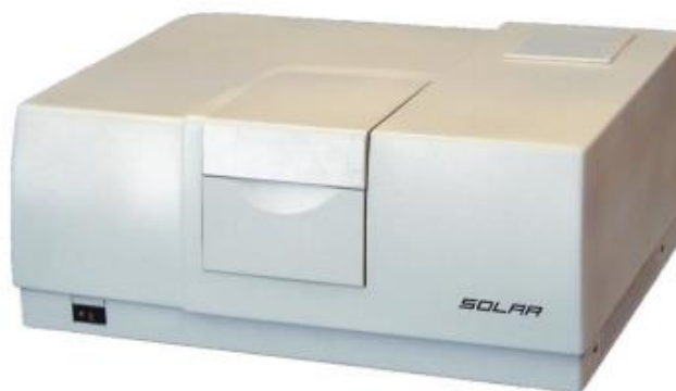
Сурет 1 – СМ-2203 спектрометрінің жалпы көрінісі

Кальций сульфаты (CaSO 4 ) және оның активтендірілген түрлері фотоникада, люминесценттік дозиметрияда және диэлектриктік материалдардағы ақаулық күйлерді зерттеуде кеңінен қолданылады [1,2]. Алайда алынған оптикалық сипаттамалардың сенімділігі спектрлік өлшеулердің сапасына тікелей байланысты. СМ-2203 спектрометрі — бұл кең толқынды ұзындық диапазонына ие және орташа спектрлік рұқсаттылықпен спектрлерді тіркей алатын ықшам құрал. Дегенмен, оның дәлдігі, әсіресе ұнтақ люминофорларына тән әлсіз сигналдарды өлшеуде, жүйелі түрде жүргізілетін калибрлеуге тәуелді [3]. Бұл жұмыстың мақсаты — СМ-2203 спектрометрін калибрлеу әдістемесін оңтайландыру және өлшеу дәлдігіне әсер ететін факторларды ескере отырып, CaSO 4 -тің оптикалық қасиеттерін зерттеу.