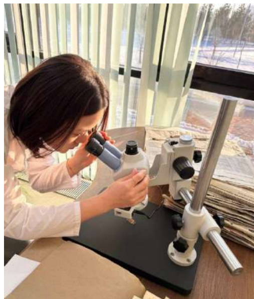
Сурет 1 Жалпы биология және геномика кафедрасының зертханасында гербарий үлгісінің жасалу барысы

Қазақстанның гербарий коллекцияларының 2016-2020 жылдар аралығындағы жағдайы туралы нақты сандық мәліметтер шектеулі. Дегенмен, осы кезеңде гербарийлерді цифрландыру және олардың қолжетімділігін арттыру бағытында жұмыстар жүргізілді.