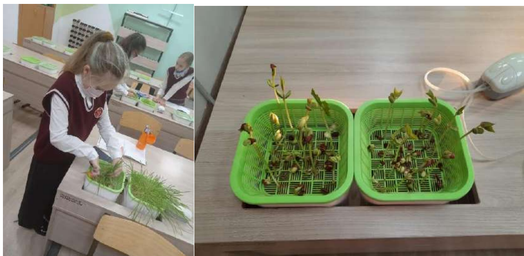
Рисунок 1 Организация лабораторных работ по гидропонике

Лабораторные работы способствуют лучшему усвоению материала, однако в большинстве школ отсутствует современное оборудование. Это снижает интерес учащихся к предмету. Эксперименты по физиологии растений часто сводятся к рассказу учителя без реальных наблюдений. Отсутствие лабораторных занятий также затрудняет изучение таких тем, как генетика, экология и биотехнология. Исходя из данной проблемы было проведено несколько лабораторных работ по гидропонике в новом формате для учеников 7-8 классов (Рисунок - 1).