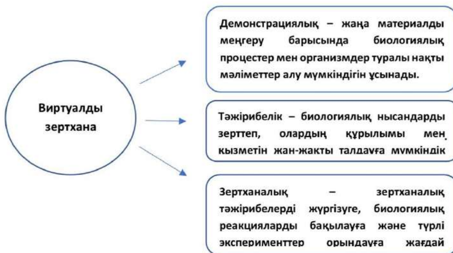
Сурет 1 Виртуалды зертхананың ақпараттық түрлері

Виртуалды зертханалардың көмегімен білім алушылар жануарлар мен өсімдіктердің құрылысын, жасуша деңгейіндегі процестерді зерттеп, түрлі биологиялық тәжірибелерді жүргізе алады [3]. Сонымен қатар, олар экожүйелердің жұмыс істеу принциптерін, генетикалық заңдылықтарды және адам ағзасының қызметін модельдеу арқылы талдай алады.