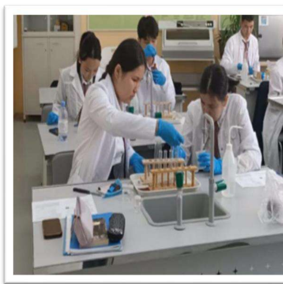
Сурет 3 Дәстүрлі зертхана жүргізу