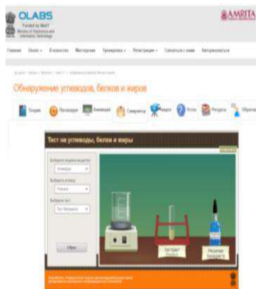
Сурет 4 – Виртуалды зертхана