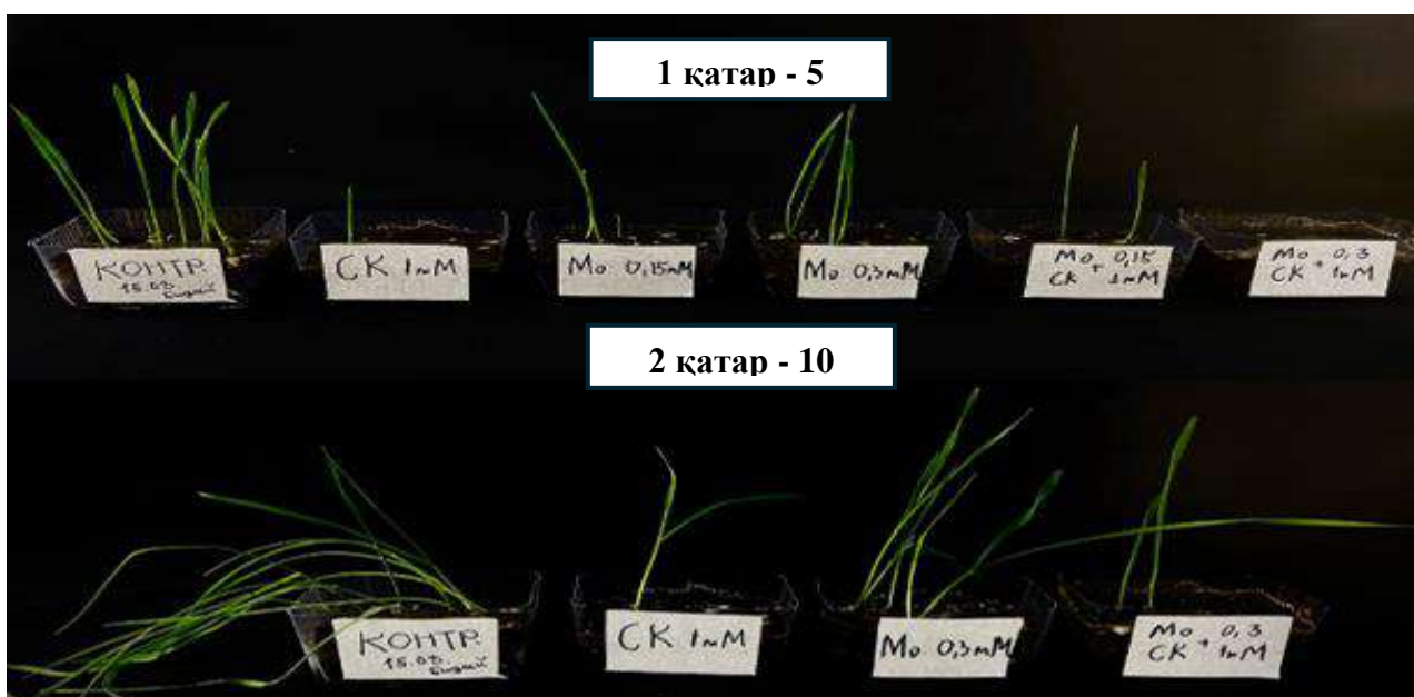
Сурет 2 Бидайдың 5 және 10 күнде өнуі мен өсуі

Жоғары көрсетілген салицил қышқылы концентрацияларда және 0.15, 0.3 мМ натрий молибдат тұзымен ылғалдандырылған топырақта 5-10 күнде бидайының өнуі мен өсуіне ауыр металдың әсерін зерттеу бойынша келесі көрсеткіштер анықталды (сурет 2, кесте 1):