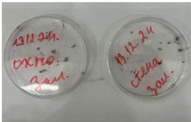
Рисунок 1 Образцы плесени с пораженных поверхностей в чашках Петри

Были собраны образцы плесени с пораженных поверхностей в чашки Петри для определения видового состава микроскопических плесневых грибов методом микроскопирования (Рис 1)