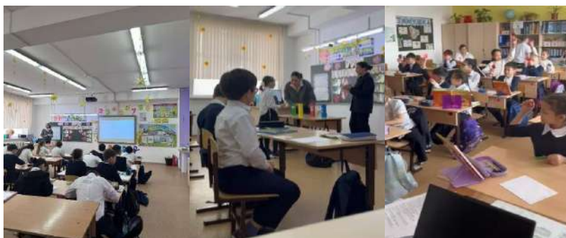
Рисунок 1 Проведение открытого урока по экологии для младших школьников в школе №16 г. Астаны

В ходе педагогического эксперимента была проведена оценка эффективности различных подходов к формированию экологической грамотности у младших школьников. В исследование входили три метода подачи информации: визуальный (использование анимационных видеоматериалов), вербальный (устное объяснение материала) и игровой