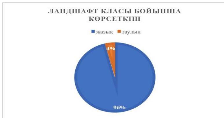
Ескерту – кесте 1 мәліметімен авторлық негізде құрастырылды

Зерттеу аумағында орналасқан геожүйелер класс бойынша В. А. Николаев ландшафтың типологиялық (құрылымдық-генетикалық) жіктеуіне сәйкес 4%-ы таулы болса, 96 %-ы жазықтан тұрады (Сурет 2).