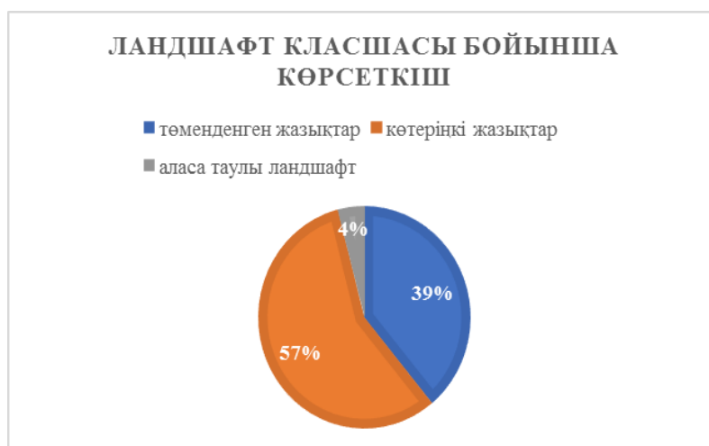
Ескертпе – кесте 1 мәліметімен авторлық негізде құрастырылды

Класша бойынша, төменденген жазықтар 39 %, көтеріңкі жазықтар 57 %, аласа таулы ландшафт 4 % ие (сурет 3).