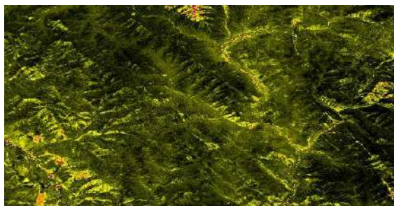
Сурет 2а Алтай таулары 2024 жаз айы

Жүктемесі жоғары аумақтарда топырақ тозуы, су ресурстарының ластануы және биоәртүрліліктің кемуі сияқты экологиялық деградация белгілері айқын көрініс табады. Осыған байланысты мұндай өңірлерде экологиялық мониторингті күшейту, ресурсты үнемдейтін технологияларды енгізу және қоршаған ортаға түсетін қысымды азайтуға бағытталған тұрақты басқару шараларын қабылдау қажеттілігі туындайды.