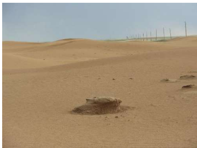
Figure 3 Akkum Sands

Among the large forms of relief, a prominent place is occupied by the structures of halogenesis located in the south of the region, which are pronounced in relief - salt dome uplifts, two relatively large unique inclined Aeolian plains. They are widely known by the names - the Karaagash and Akkum sands (Fig.3). The uniqueness of the considered inclined Aeolian plains is determined by their location within the Poduralsky plateau, which is the oldest surface of the territory of the region.